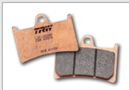
SV/SH SINTER STREET