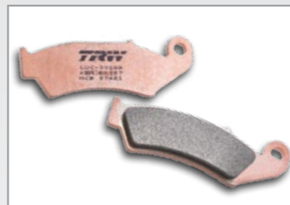
SI SINTER OFFROAD